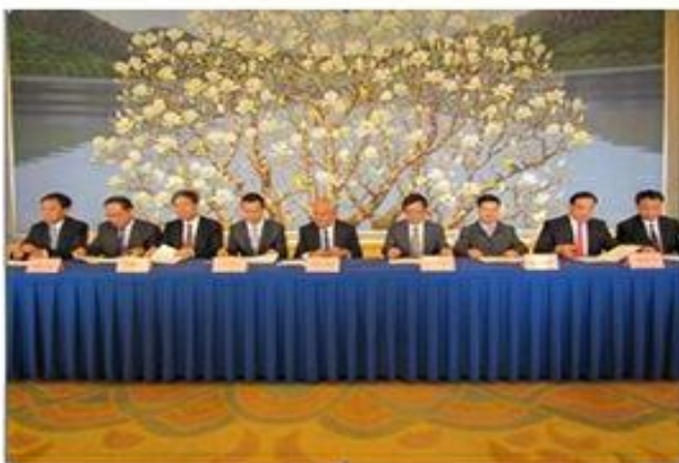
图为中法产业合作相关各方签署合作备忘录。

为全面落实中法两国领导人达成的中法产业合作系列共识，共同推进“中国制造2025”同法国“未来工业计划”对接，进一步促进中法两国经济文化交流与产业合作，深入推进中法产业合作项目落地实施，中法产业合作相关各方于5月27日在北京饭店签署了合作备忘录。