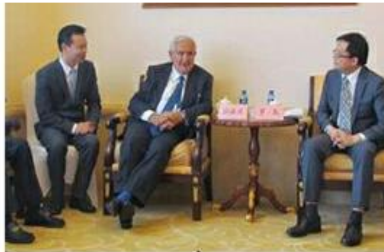
图为拉法兰先生与罗主任亲切交谈。