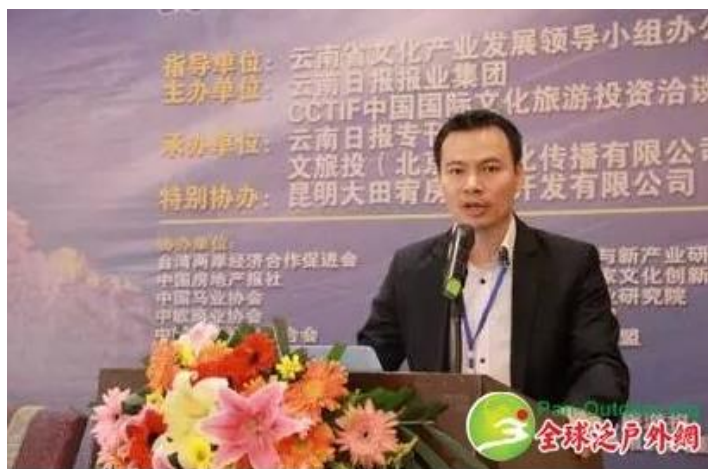
胡雄哲：中欧商业协会会长